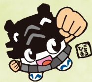
熊本市イメージキャラクター 「ひこまる」

『りんくす熊本』は、 熊本市内・市内近郊にある 公共施設から楽しい情報を 発信する情報誌です！